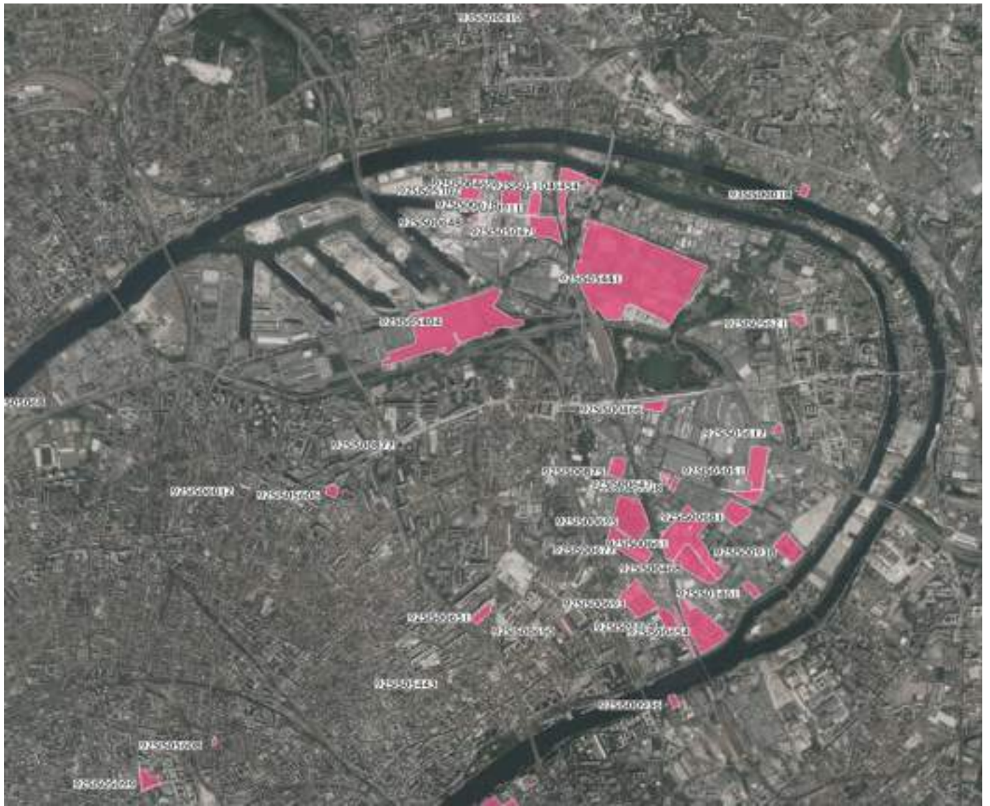
Secteur d'Information sur les Sols (SIS)