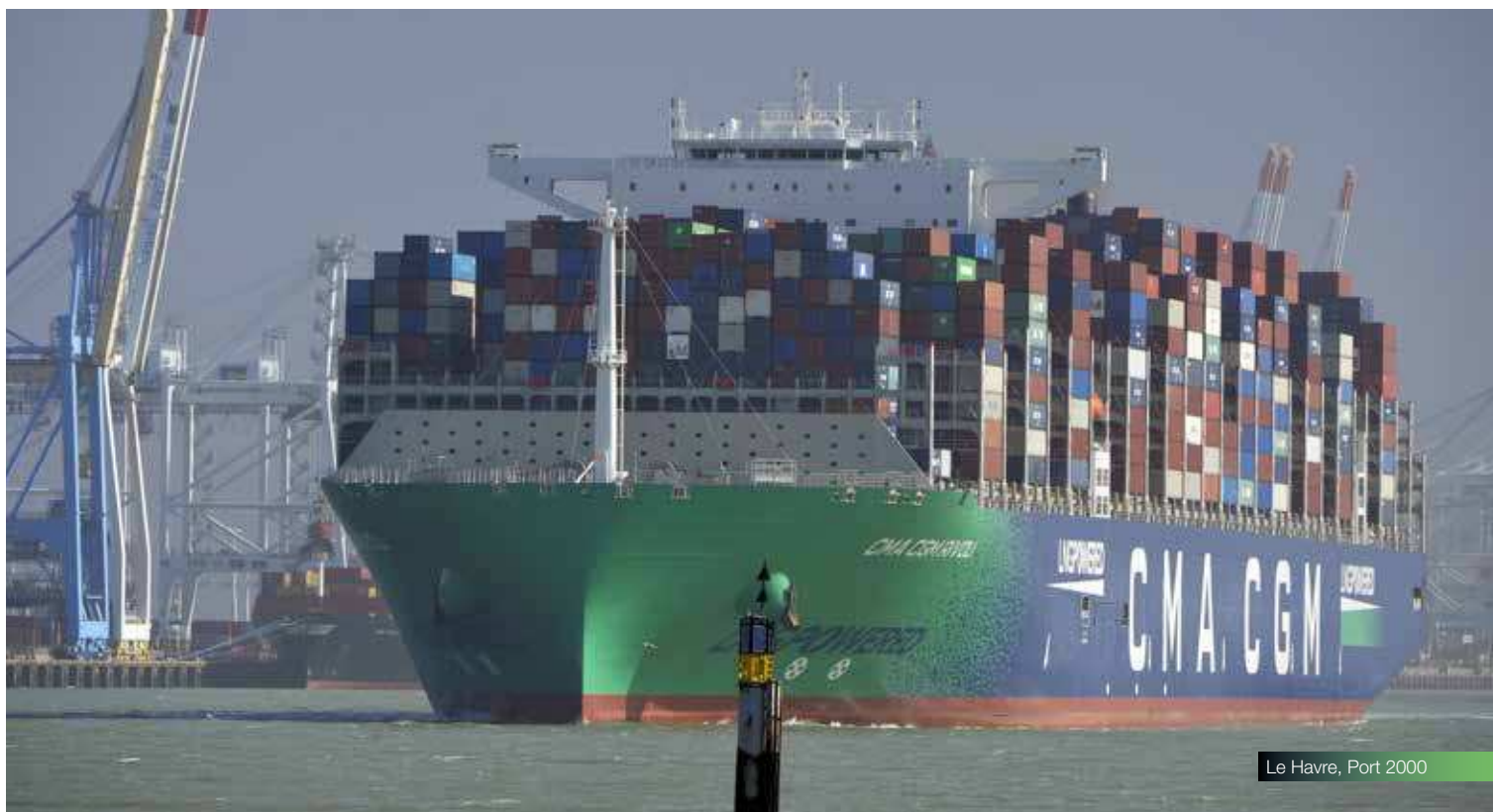
Le Havre, Port 2000

À la suite d'un appel à projets lancé par HAROPA PORT, ENGIE a implanté des stations multi-énergies à Limay-Porcheville et Gennevilliers, incluant une unité de production d'hydrogène. L'entreprise Distry de son côté en installera à Bonneuil-sur-Marne, Bruyères-sur-Oise et Montereau-Fault-Yonne. Ces stations complètent celles existantes le long de l'axe Seine , et notamment la station d'avitaillement GNV implantée sur la zone industrialo-portuaire du Havre à proximité des parcs logistiques.