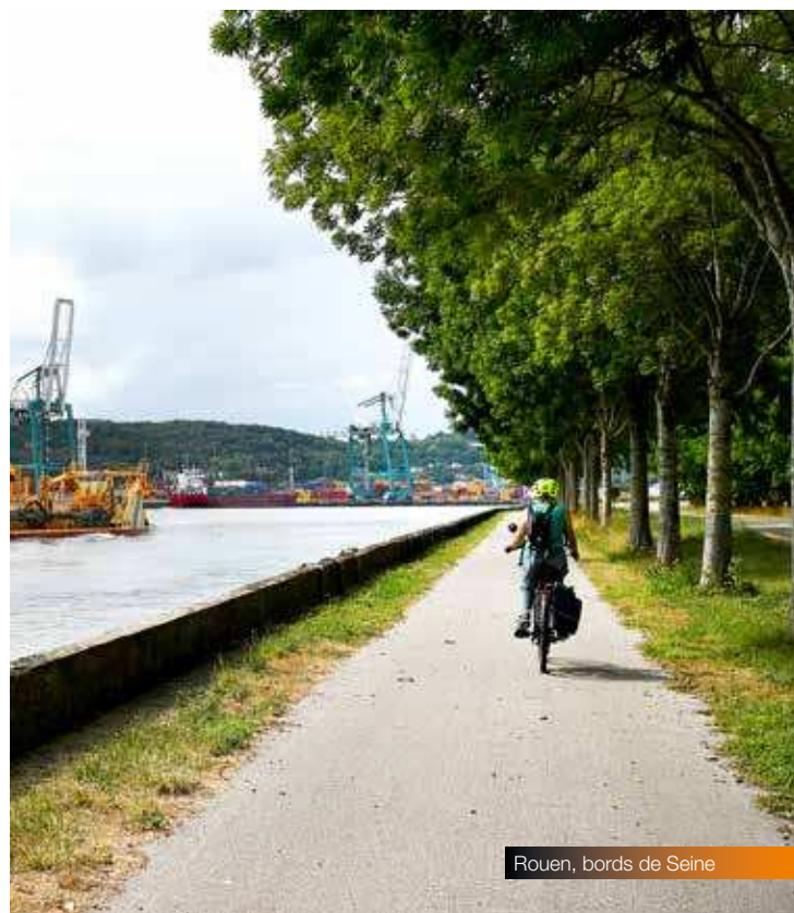
Rouen, bords de Seine