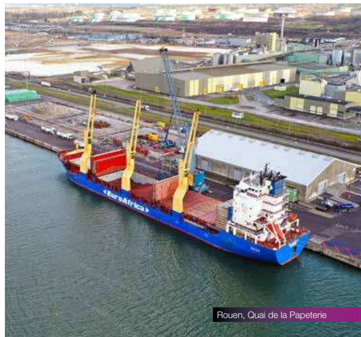
Rouen, Quai de la Papeterie

Plateforme collaborative électronique appelée Port Community System (PCS) de 4 e génération, le Guichet unique portuaire (GUP) offre désormais un seul point de connexion à l'ensemble des parties prenantes de la chaîne logistique. Accessible 24/24 et totalement automatisé, ce guichet assure la transmission instantanée et le partage des informations pendant les opérations portuaires. Il permet une gestion fluide et rationalisée de la chaîne d'approvisionnement, contribue à la décongestion des ports et offre aux clients une libération plus rapide de leurs marchandises.