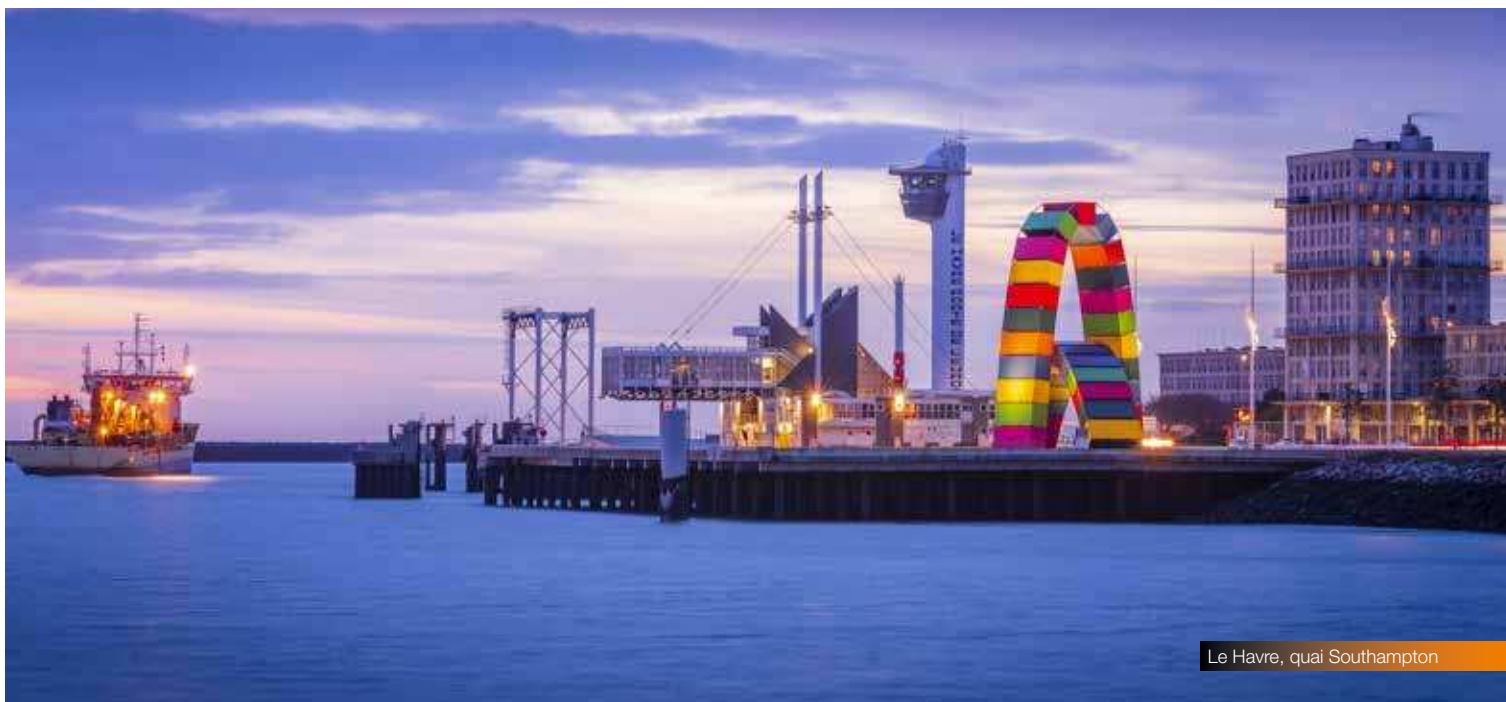
Le Havre, quai Southampton

sur des thématiques d'attractivité du territoire, d'innovation et de développement économique.