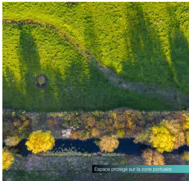
Espace protégé sur la zone portuaire

HAROPA PORT participe au Programme d'action pour le climat des ports mondiaux (World Ports Climate Actions Program - WPCAP), engagement volontaire de 13 ports internationaux qui, ensemble, veulent ouvrir la voie et contribuer à l'élaboration de futurs standards. Ces travaux collectifs constituent une condition indispensable pour agir vite et efficacement. Parmi les priorités : le branchement électrique à quai des navires, pour améliorer la qualité de l'air et réduire les émissions de CO 2 dans le port.